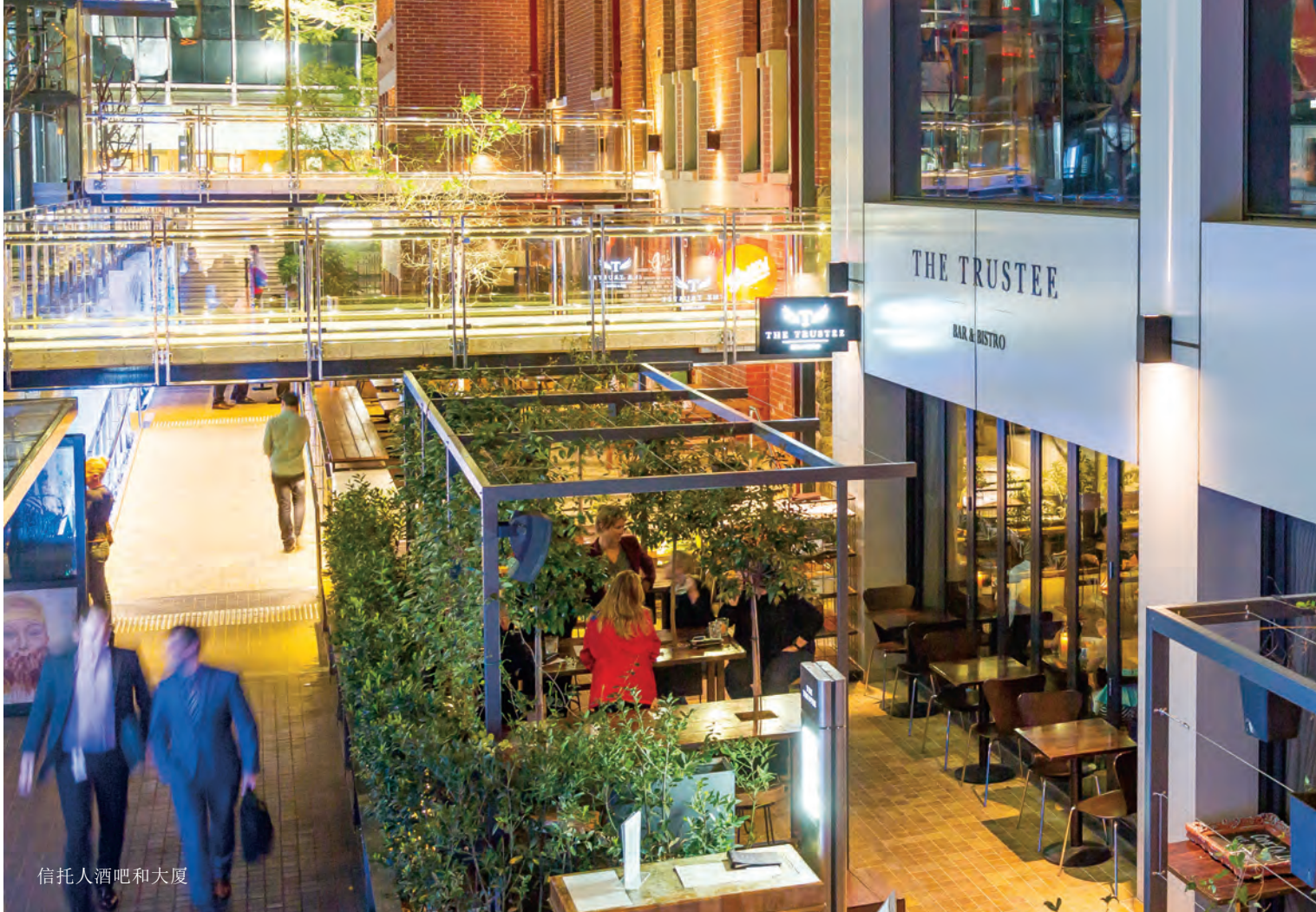
信托人酒吧和大厦