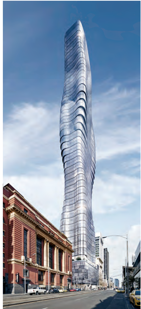
PREMIER塔楼 墨尔本 premiertower.com